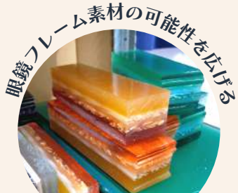
眼鏡フレーム素材の可能性を広げる

鯖江のメガネフレームと同じ素材で製作されています。アクセサリーという新しいフィールドで、鯖江の新たな魅力を発信します。