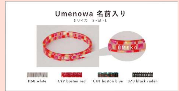
⑤【セット】 Umenowa+同じ色のアクセサリ 18,150円